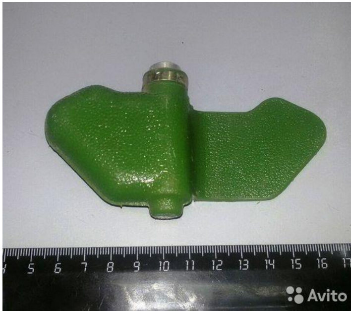
«Мина –ЛЕПЕСТОК» в боевом положении на земле (присыпана грунтом):