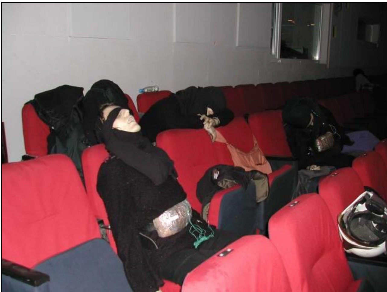
Террористки-смертницы, участвовавшие в захвате заложников в Москве («Норд-Ост»)

могут не подозревать, что они заранее отнесены к числу жертв и используются «в темную» по воле других людей в качестве «контейнеров» и средств для доставки взрывчатки к цели. При таком способе организации террористической акции исполнителю ставится задача оставить в назначенном месте взрывчатку или сумку, о содержимом которой он может не знать, а в лучшем случае лишь догадываться, но при этом данный участник террористической акции не ставится в известность о том, что его дальнейшая судьба предрешена.