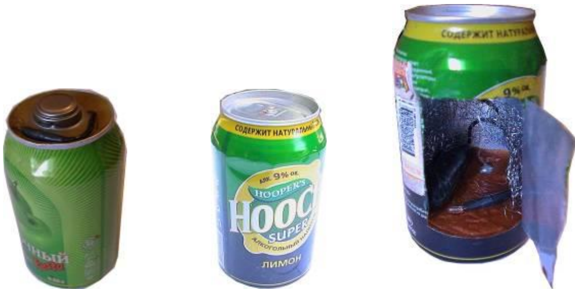
Самодельные взрывные устройства в банках из-под напитков