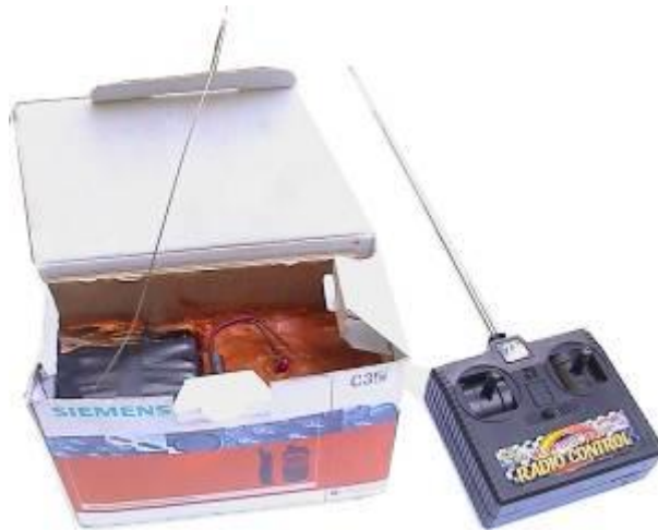
Примеры маскировки СВУ