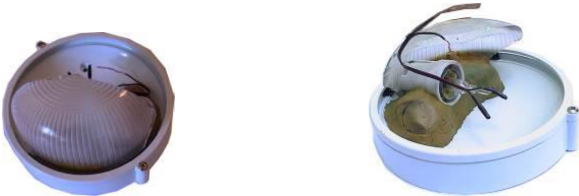
Самодельное взрывное устройство в световых плафонах