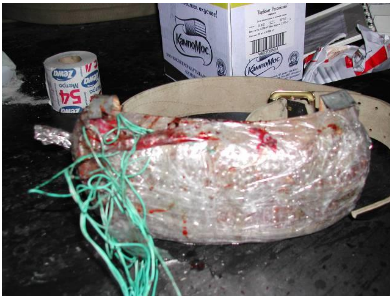
Взрывное устройство, крепящееся на теле террориста-смертника