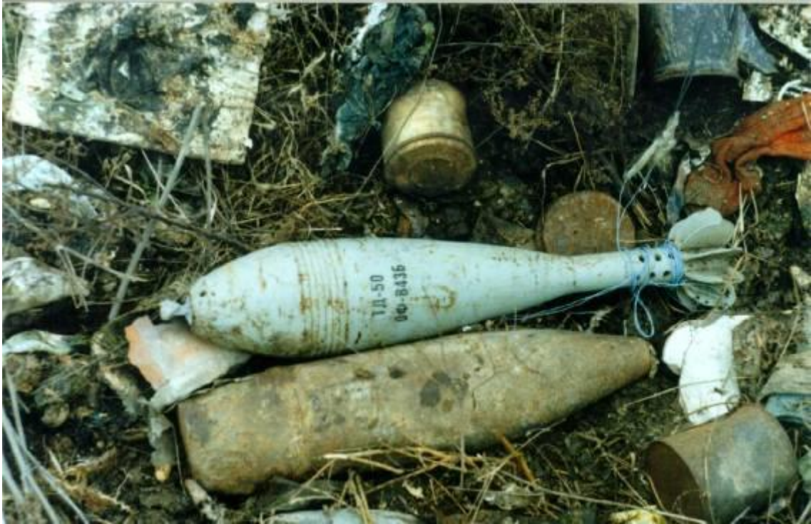
Самодельное взрывное устройство на основе штатных боеприпасов