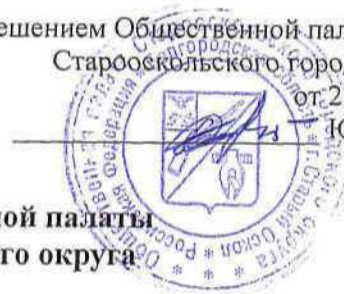
ГРАФИК приёма граждан Общественной палаты Старооскольского городского округа на 2025 год