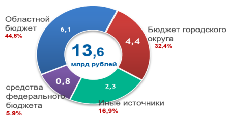
Структура расходов муниципальных программ Старооскольского городского округа в 2023 году