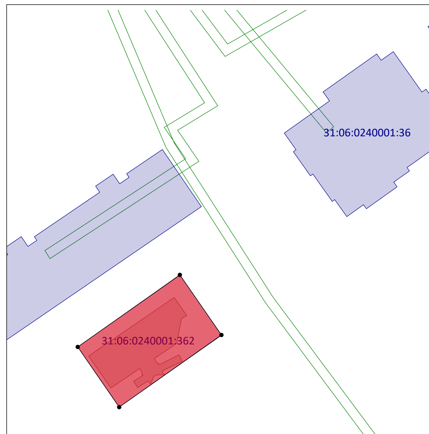
Схема расположения земельного участка на кадастровом плане территории